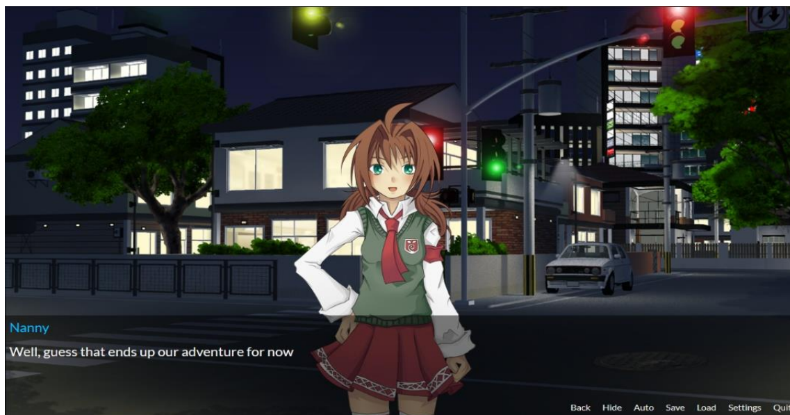
Imagem 1. Demonstração de jogo criado com Monogatari.io

A principal ferramenta utilizada neste projeto foi o Monogatari (monogatari.io), definido como um framework (uma abstração que une códigos comuns provendo uma funcionalidade genérica) cuja finalidade é a criação de um visual novel . Em outras palavras, o Monogatari funciona como um motor de desenvolvimento de jogos do tipo visual novel que não exige do usuário o conhecimento de programação de computadores, caracterizando-se como uma ferramenta intuitiva de simples edição.