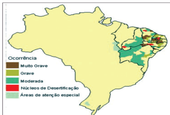
Figura 1 – Desertificação: áreas afetadas

Segundo o Plano Nacional de Combate à Desertificação (BRASIL, 2005, p. 11), existem três categorias de susceptibilidade à desertificação em conformidade com o índice de aridez. Essas três categorias são: muito alta (de 0,05 a 0,20); alta (de 0,21 a 0,50) e, moderada (de 0,51 a 65). O mapa a seguir (figura 1) demonstra áreas do Semiárido afetadas pelo processo de desertificação.