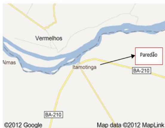
Figura 2 – Localização do Distrito Itamotinga/BA

Após o levantamento bibliográfico da pesquisa bibliográfica, partiu-se para a pesquisa de campo in lócus . A pesquisa de campo foi conduzida na Comunidade de Paredão, Município de Juazeiro/BA (figura 2), que apresenta temperatura anual em torno de 30°C, com clima semiárido e, presença de pouca umidade, bastante evaporação das águas e vegetal hiperxerófila, como, cactos ( Cactaceae ), xique-xique ( Pilocereus gounellei ), mandacaru ( Cereus jamacaru ), coroa de frade ( Melocactus bahiensis ), etc..