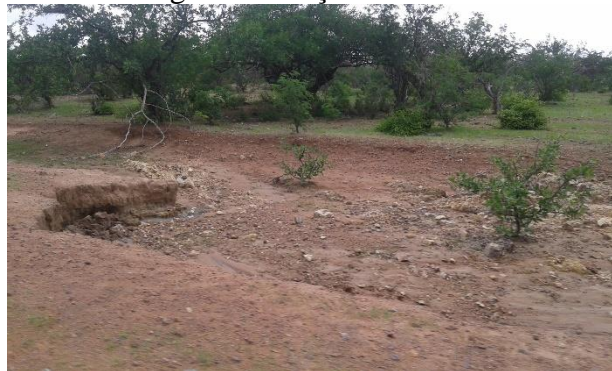
Figura 6 – voçoroca no solo