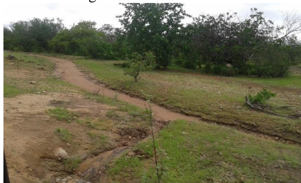
Figura 5 – ravina no solo

época de chuvas, por conta das incontáveis erosões. Ao final da pesquisa, constatou-se que dos trechos de matas escolhidas para fazer a análise comparativa, no primeiro, a dificuldade de acesso humano a determinadas áreas serranas e de mata fechada, proporcionava menor índice de erosão dos solos e maiores índices pluviométrico no local; no segundo, uma das maiores causas da degradação do bioma caatinga, foi à retirada da mata nativa para dar origem a grandes latifúndios e, em segundo lugar, o pisoteio dos animais por conta da prática da pecuária e agricultura extensiva.