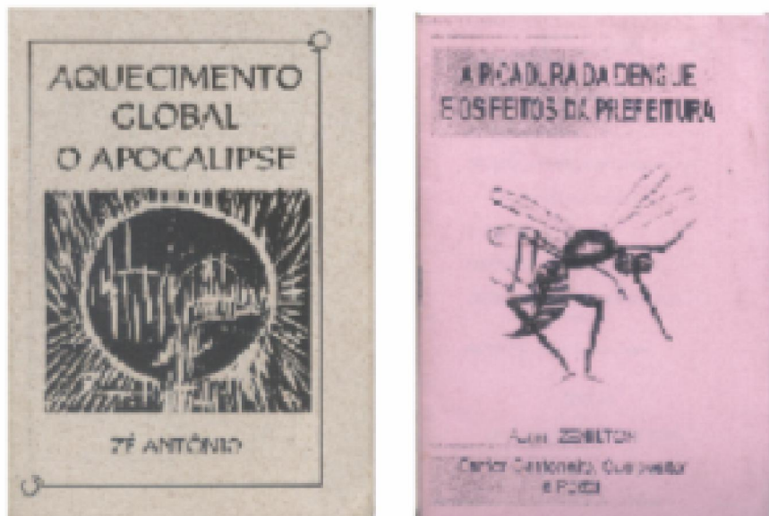
Figura 1: Capas de livretos: Aquecimento global o apocalipse , A picadura do mosquito da dengue .

“Aquecimento global, o apocalipse”, “A picadura do mosquito da dengue” e “A peleja da ciência com a sabedoria popular”. A figura - 1 ilustra a capa de dois panfletos de cordel: